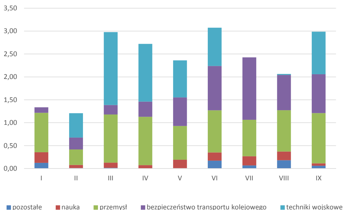
Wykres 2 Sprzedaż do końca III kwartału 2015 r. wg aplikacji [mln zł]

W III kwartale br. dominowała sprzedaż dla zastosowań kolejowych. Na stabilnym poziomie utrzymuje się również sprzedaż dla zastosowań przemysłowych (wykres 2).